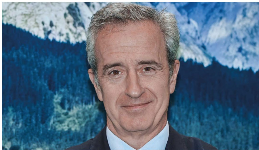
Eduardo de Lecea, director general de SIGAUS.

En 2019, el Gobierno balear publica su propia ley de residuos y suelos contaminados (Ley 8/2019) vigente desde 2020 y que aplica la RAP a los envases comerciales e industriales. Entre las empresas afectadas se encontraban varias de las compañías adheridas a SIGAUS, por lo que creamos un nuevo sistema desde el que darles respuesta.