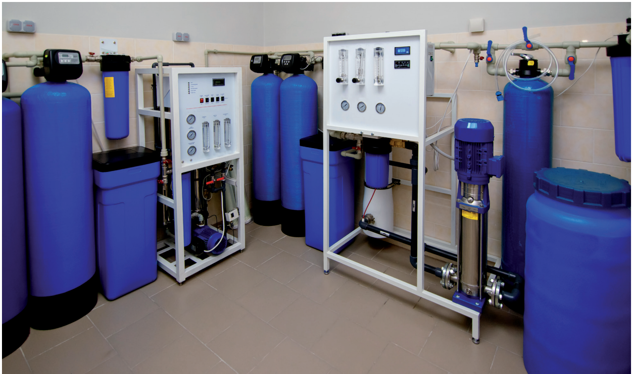
Planta de agua pura, laboratorio con filtros para el tratamiento de aguas.

Una vez obtengamos la autorización para operar a nivel nacional como SCRAP de envases comerciales e industriales, empezaremos a operar garantizando a las empresas afectadas por esta norma (es decir, aquellas que envasan o importan productos en envases comerciales e industriales, a quienes considera 'Productoras') el cumplimiento de sus obligaciones en materia de gestión de residuos de esos envases, ya en todo el territorio.