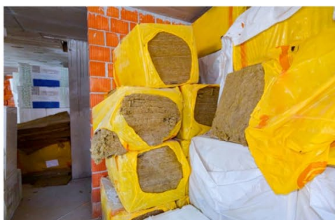
A la izquierda, un almacén con sacos construcción; Y a la derecha, paquetes de aislamiento térmico.